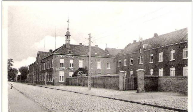
Heusden Kostschool der Urselinnen

Boeiende vertellingen van vroeger! Noteer dit nu reeds in uw agenda.